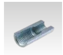
Filetage ≥ M8/M10