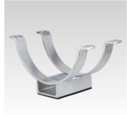
UPG-2 et coquilles ISO type 170 EX - à commander séparément